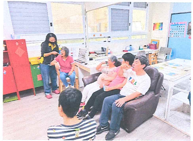
113年11月口腔清潔課程