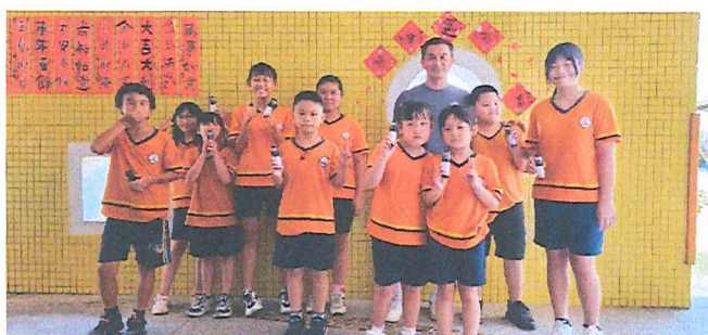
113.10月 社團募集防蚊液發送