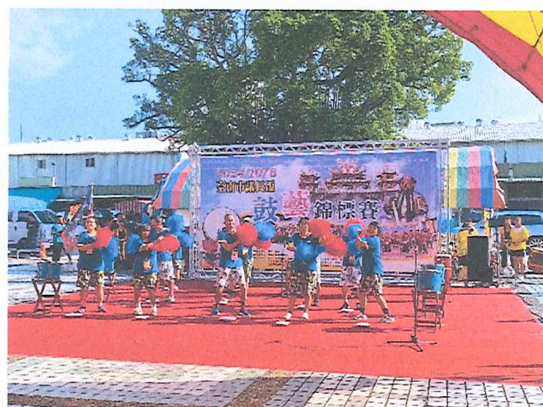
113年10月新豐鼓舞嘉年華會