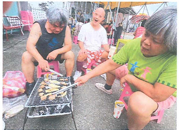
113年9月中秋節同樂會