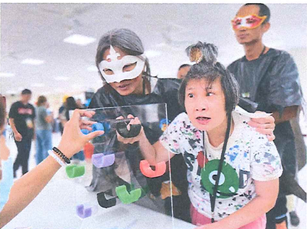
113年10月萬聖節變裝運動會