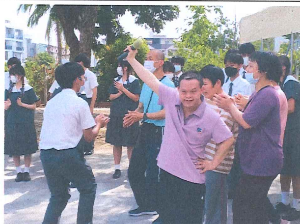
113年慈濟高中團康活動