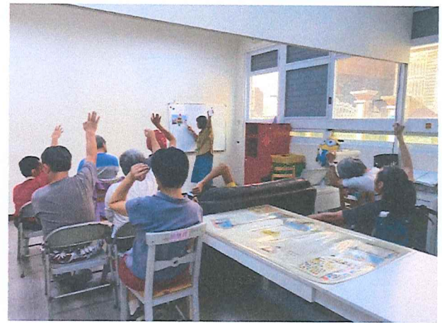
113年10月社區參與投票