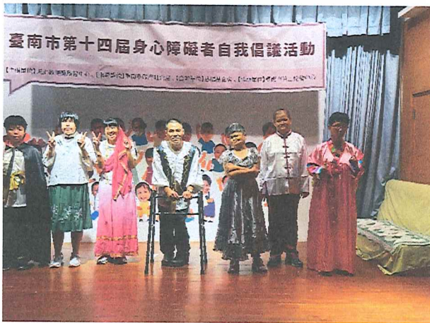
113年9月德蘭自主倡議