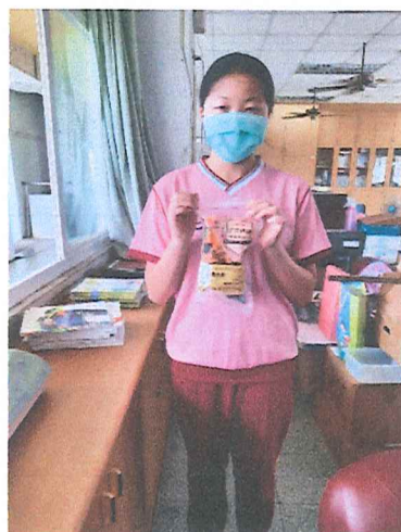
113.6月 個案服務-粽子發送