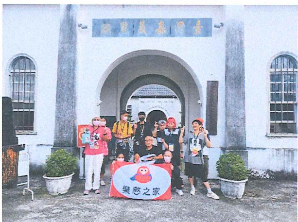
113年10月嘉義舊監獄參觀