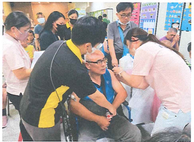
113年10月流感疫苗施打