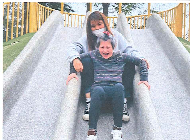
113年3月健康綠洲公園