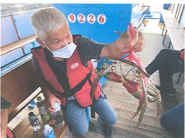
113年6月七股瀉湖坐船吃蚵