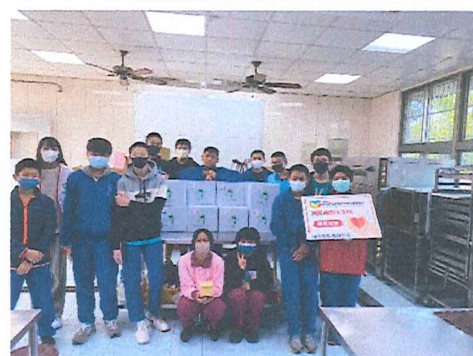
113.11月 營養補助計畫食物鄉發送