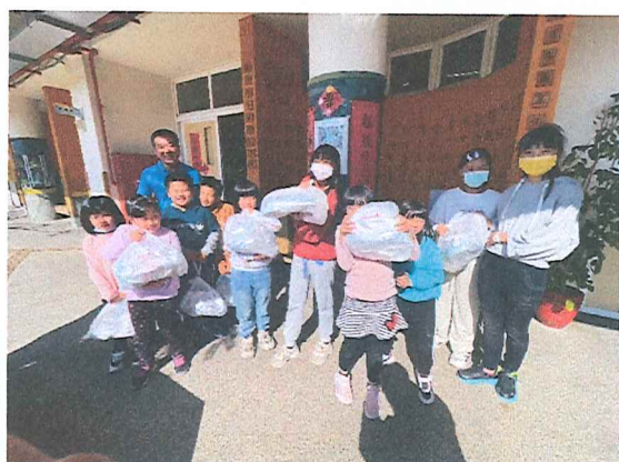
113.06月 個案服務-營養品捐贈