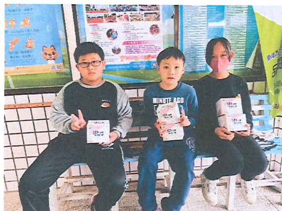
113.07月 個案服務-口罩捐贈