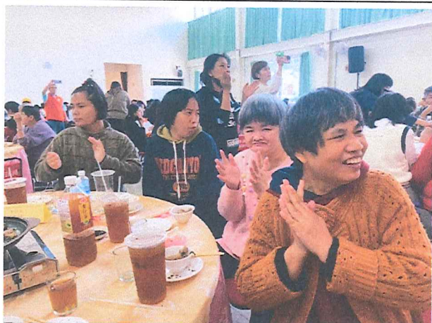
113年1月受邀參與歲末關懷幸福餐會