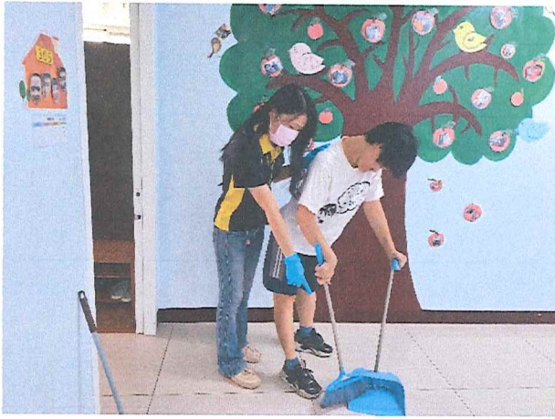
113年1月清潔作業課程